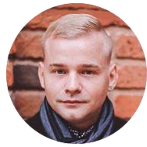
Був Антон #Визуализация